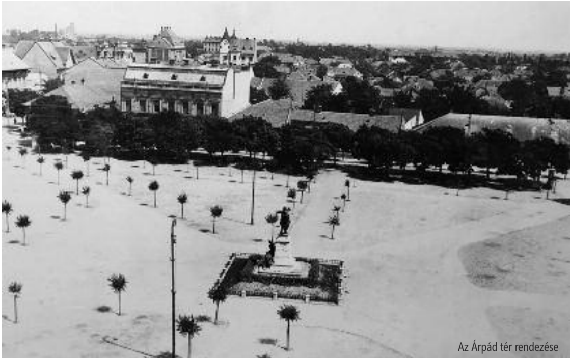
Az Árpád tér rendezése

ra, ahol az ajtókat nyitva találva, míg a házbellek az alsó lakásban foglalatostkodtak, a vakmerő tolvaj tizenötezer korona értékű fehérneműt összeszedett. A károsultak hamar észrevették a tolvajmunkát és a rendőrségre siettek s rendőri segítséggel a pályaudvaron sikerült is lefogni a tolvajt, mint éppen vonatra akart szállani. Tettét beismerte s a rendőrség átkísértette a kecskeméti ügyészségre.” (Czeplédi Kisgazda, Czepléd, 1922, 47-ik szám. Vasárnap október 15. 2. o.).