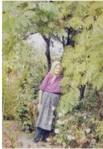
Az első albízia Cegléden